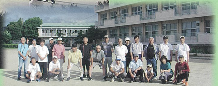
大沼学区コミュニティ推進会関係者