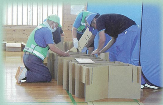
段ボールベッド組立て訓練

大沼学区コミュニティ推進会は「防災部」が中心となり、訓練シナリオに沿って実施しました。訓練は、市職員で構成された「避難所運営班」の合図で、防災備蓄倉庫内の備品搬出から避難パーテーション・段ボールベッドの設置、簡易トイレの設置、資機材取扱訓練等、いざという時の備えのための訓練が熱心に行われました。最後に参加者全員が、今後の訓練に活かすため、改善要望等を出し合い訓練を終了しました。猛暑の中参加いただきました皆様、大変お疲れ様でした。