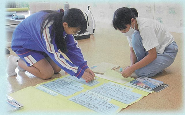
児童室での学習風景